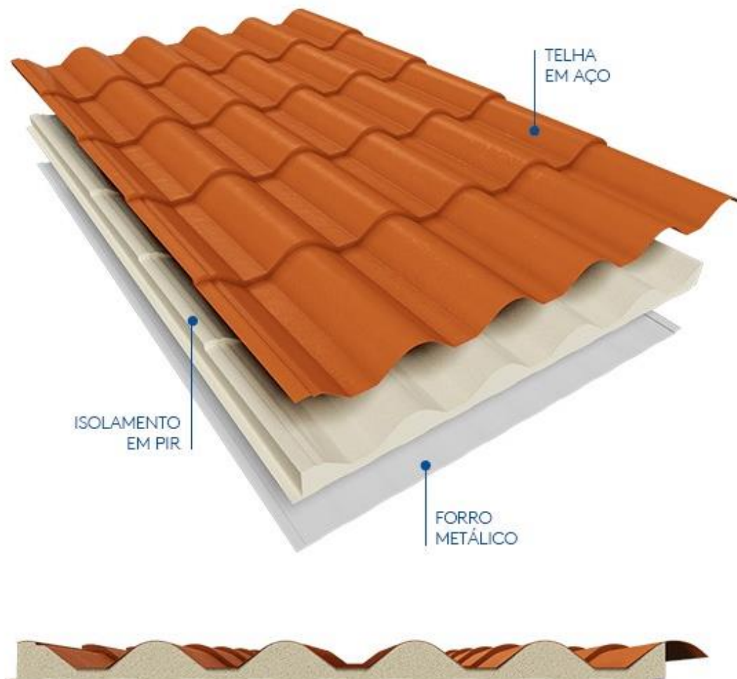
Figura1- telha que será utilizada para na cobertura.