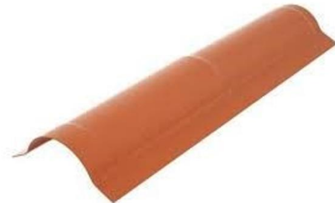
Figura2-Cumeeira que será utilizada na cobertura.