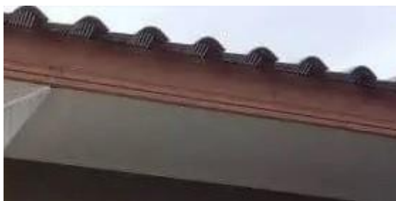
Figura3-Detalhamento de beiral.